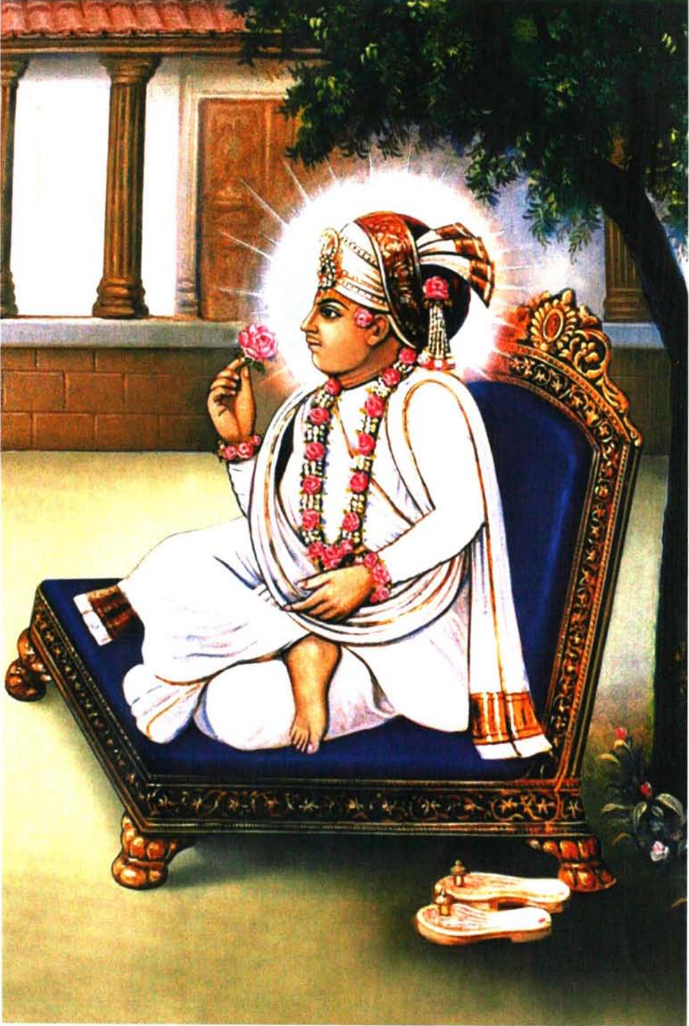
सर्वोपरि उपास्य मूर्ति पूर्ण पुरुषोत्तम श्री स्वामिनारायण भगवान